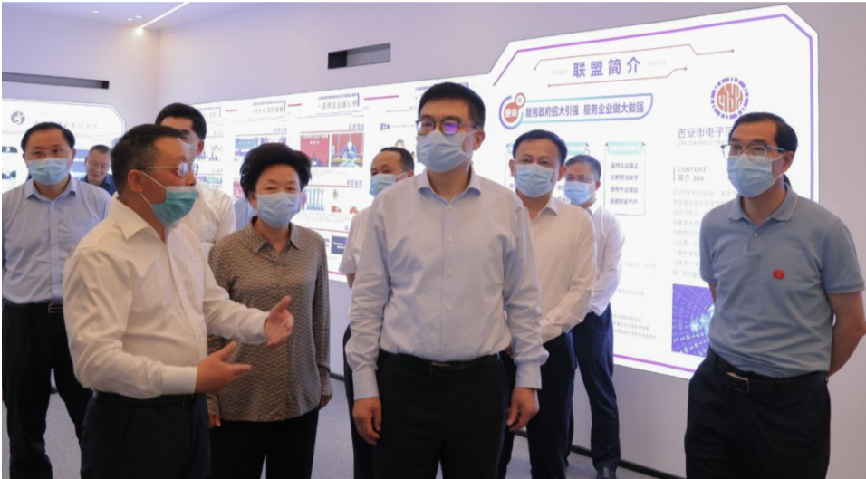
省委常委梁桂调研市域产教联合体建设情况

(文/宣传部 黄森文)5月10日,省委常委梁桂在井冈山经开区调研职业教育改革提升、市域产教联合体建设等工作。省委办公厅副厅级督查专员、省档案局局长聂文胜,省委