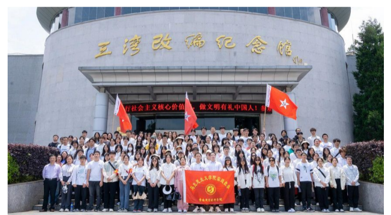
在三湾改编纪念馆实践教学

(文/马克思主义学院 张良)为深入学习贯彻党的二十大精神,扎实推进主题教育走深走实,继承先辈遗志、传承井冈星火,提升大学生的思想政治素质。5月13日,马克思主义学院组织全校150余名师生赴永新开展了“追寻红色足迹 感悟革命精神”的主题实践活动。