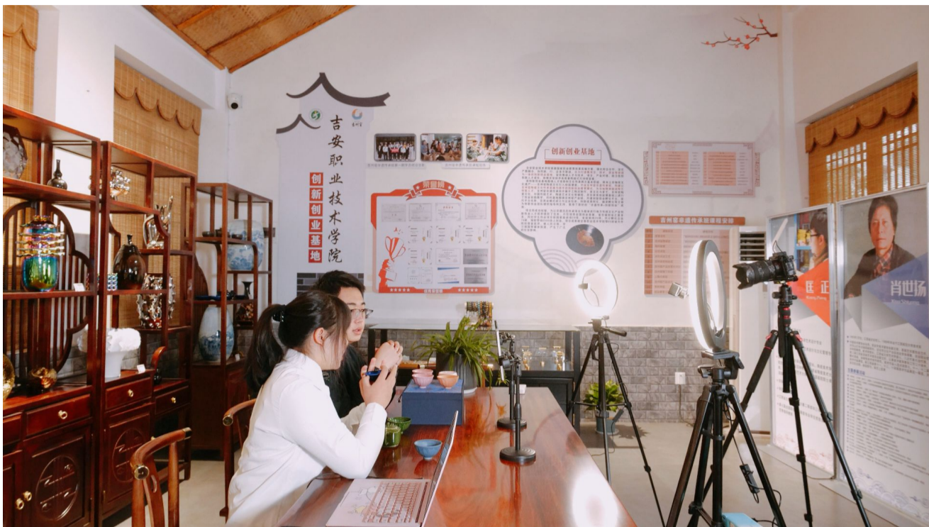
学生在直播介绍吉州窑陶瓷

党的二十大报告中指出,中华优秀传统文化源远流长、博大精深,是中华文明的智慧结晶,强调要坚定文化自信、文化自觉、文化自强,坚持古为今用、推陈出新。非遗文化是中华优秀传统文化的重要组成部分,是中华文明绵延传承的生动见证。保护好、传承好、利用好非物质文化遗产,对于延续历史文脉、坚定文化自信、推动文明交流互鉴、建设社会主义文化强国具有重要意义。吉安是一座具有悠久历史的文化名城,蕴含丰富的非物质文化遗产。吉安职业技术学院作为一所地方性高校,每年为地方基础教育输送约1000名定向师范