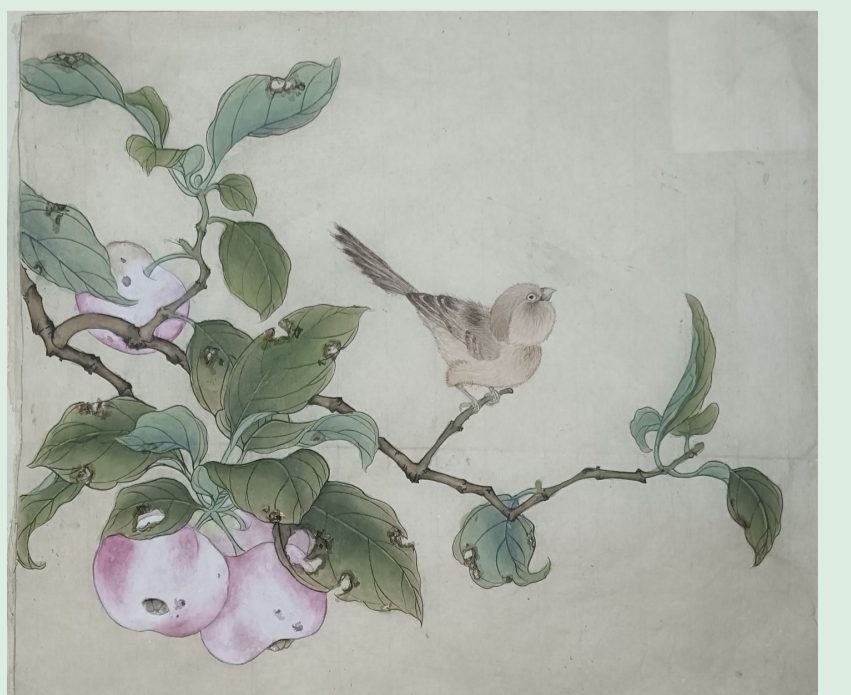
《菱婆山鸟图》小学教育学院 20 小教五(8)班 郭淑敏